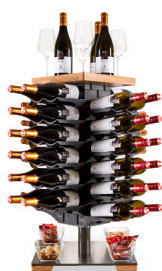
Abb. Symbolbild KT2