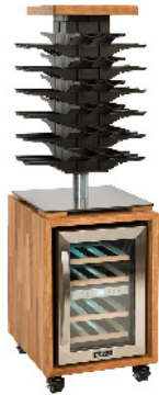
Abb. Symbolbild KT2 inkl. Kubus und Kühler

Tischkarussell, drehbar 48 oder 72 Flaschen mit Weinkühler