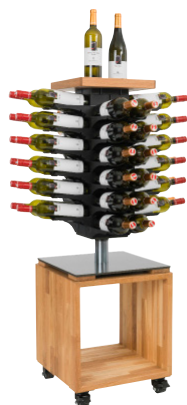
Abb. Symbolbild KT2 inkl. Kubus

Tischkarussell, drehbar 48 oder 72 Flaschen